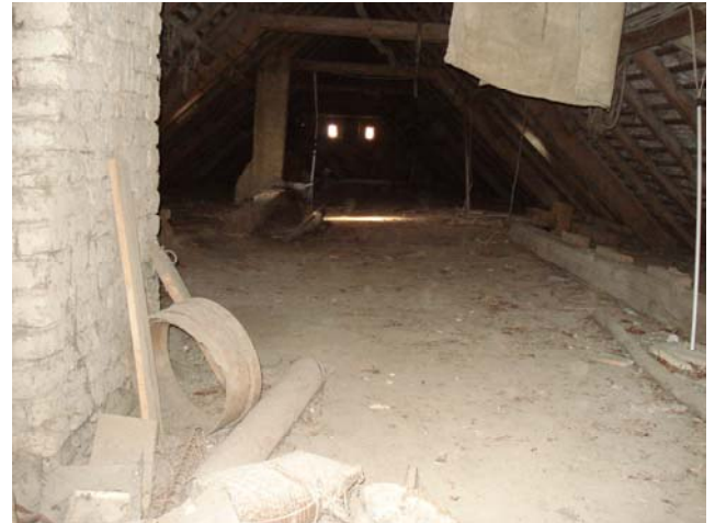
Padlástér átalakítás előtt