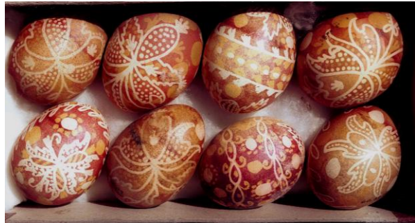
Hímes tojások a Türr István Múzeum gyűjteményében

A régi minták irkalapokon, kalendáriumok szélén, szabásminták hátuljára rajzolva maradtak fenn. Feltüntették mellettük, hogy kinek a mintája.