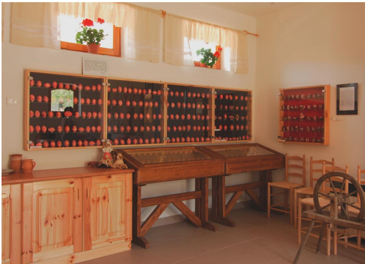
Állandó kiállítás, 2005

A kiállítás célja ráirányítani a figyelmet a hímes tojásra, erre a törékeny csodára.